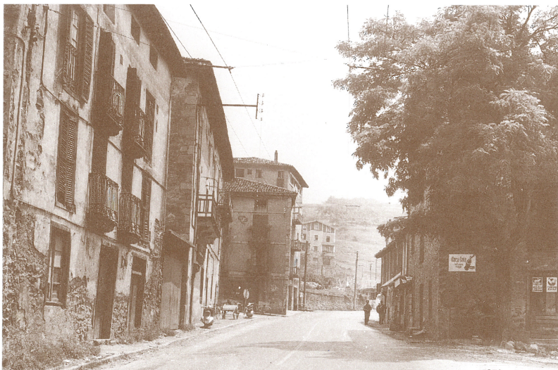
Kaleberria, orain Kutxa dagoen lekutik ikusita. Eskuinean, Brunoren etxea zena. MOISES

"Republika garaian eduki zuen gure aitak gasolindegia. Baina leku txarra zela-eta utzi egin zuen aitak. Izan ere, Donostia bidean hantxe gelditzen zen tranbia eta autoek ezin izaten zuten gasolina hartu".