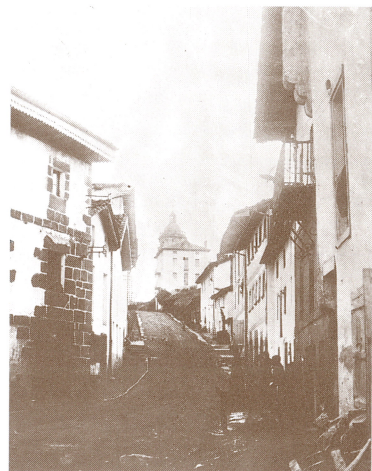
Kaletxikiko aldapa malkartsua.

hori Kaletxikin gordetzen da oraindik ondoen.