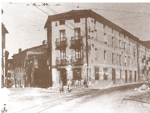
Artolanea, Banco Guipuzcoano eraiki aurretik Zumea eta Kaleberriko bidegurutzean zegoen etxea.