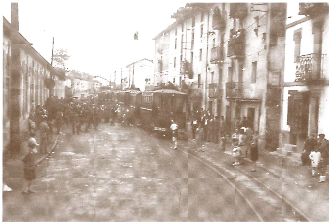
Tranbia berrien bedeinkazioa Zumeako zentrala zenaren parean.