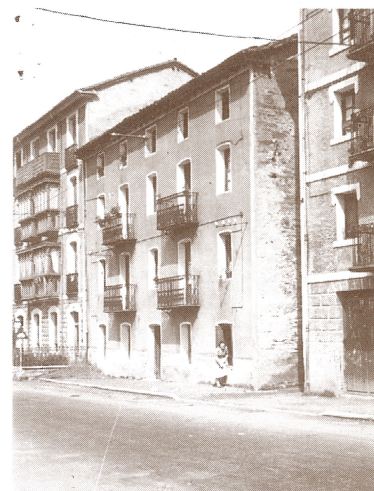
Etxeberrietako 3. ataria.

Etxeberrietako eskolak egiten zuen auzoaren muga. Handik aurrera zeuden etxeak Karrikakoak ziren: "Karrikako errota, Karrilia ñarroak konpotzen zituzten bertan- Asindegi base- rria, Itsuaren baserria eta Iztuitza torrea, horiek ziren etxe nagusiak", gogoratu dute denek artean.