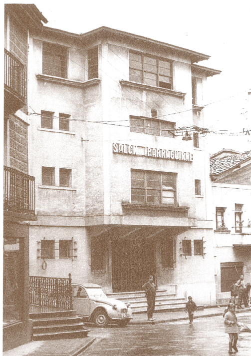
Iparragirre zinema Kale Nagusian. Aurrez Cine Luminoso izan zen. EMILIO TRUCHUELO

Kale Nagusian bueltan, berriz, Subijanaren kooperatiba egon zen (orain Leizaur denda dagoen lekuan), Arregitarren harategia segidan, eta gero baratzak. Orain eskilarak dauden lekutik aurrera, berriz, etxebitz-