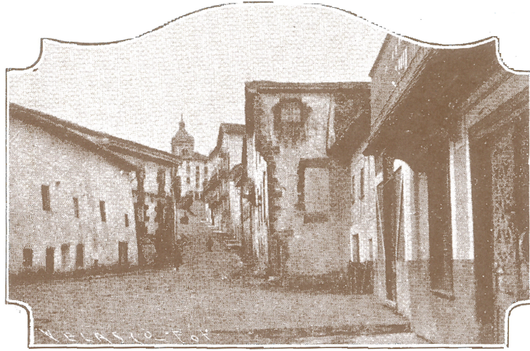
Kaletxiki auzoa. Orain urte gutxirarte, San Pedro kalea zen argazkian ageri dena.