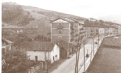
Etxeberrieta Etxe Urdina zegoen lekutik hartutako irudian. EMILIO TRUCHUELO

Etxeberrieta da, Andoaingo auzo guztien artean, gutxien aldatu den ingurua. Erreka aldera zegoen futbol zelaia eta haren inguruan Barria eta Olasagastitarren baserria; gero, Subijanakako lantegia. Auzoaren bihotza, ordea, errepidearen beste aldean zegoen; Zipitrianean hasten den etxe sail luzeak osatzen zuen auzoa. Etxe horiek denak bere horretan daude oraindik ere.