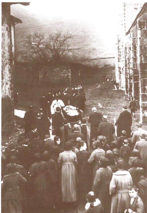
Aintzina-aintzinako hileta bat San Martinen.

"Gogoratzen naiz behin baino gehiagotan", jarraitu du, "Santakruzetan Etxeberrieta alderaedo joatea tokatu eta nola topatu genuen banda jotzen eta jendea dantzan Zumean. Baina segizioa bazetorrela konturatu orduko derrepente geratzen zuten musika, denak belaunikatu, apaiza pasa, eta gure atzetik jarrita banda martxa funebrean jotzen hasten zen".