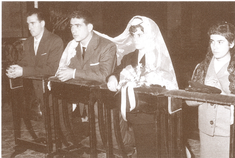
Bikoteari zapi zuria jartzen zioten ezkontzetan; senargaiari lepotik behera eta emakumeari burua estaliz, haren menpekotasuna adierazteko.

"Ezkondu egiten zen sakristian. Behin bedeinkazioa hartuta, ateratzen ziren bertatik apaizaren alde batera ezkondu tako andrea, eta bestera, senarra jarrita. Prozesio txiki batean, joaten ziren aldareraino eta han meza hasten zen"