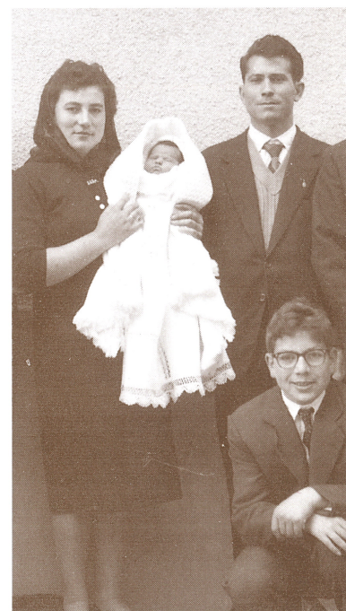
Umea elizan sartzeko egunean ateratzen zen lehen aldiz ama kalera.