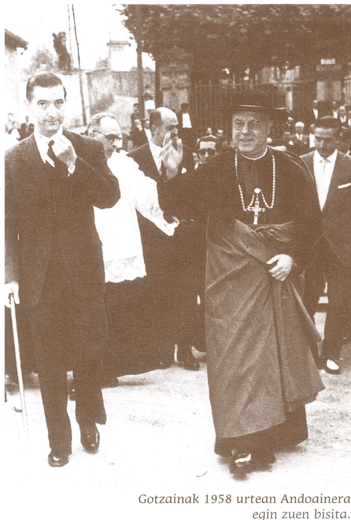
Gotzainak 1958 urtean Andoaínaera egin zuen bisita.