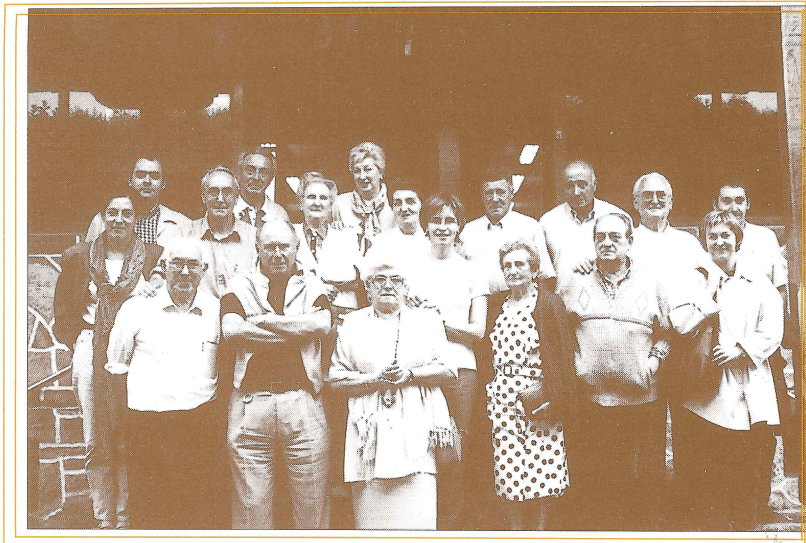
Urte eta erdian solaskide izan ditugun andoaindar berritsuak eta proiektu honetan parte hartu dugun gainerantzekoak bazkaritan bildu ginen joan den ekainaren 3an. Borda jatetxeak prestatu zituzten bazkari goxoak, solasak eta bazkalosteko kantu saioak eman zitoten agurra 1998ko gabonetan abiatu genuen abentura polit honi.

Etzeko lanetaz ari ginela, Upategin mentak labean sartzen zirela idatzi