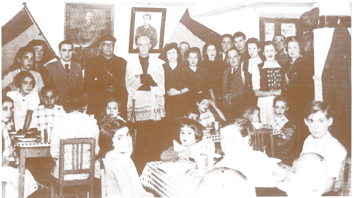
Auxilio Socialaren egoitzan jaten Andoaingo haur batzuek.

Andoainen oparotasunean bizi ziren sendiak baziren gerra aurretik: Treku, Moleda, Unanue... Auto baka- rren batzuk ere baziren. Baina gerrak aldaketa sakonak ekarri zituen, eta gerra osteak gosete latza.