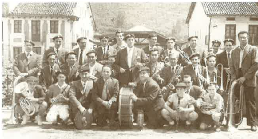
Musika banda, 1958 urteko Santa Zezilia egunean, udaletxeko terrazan.