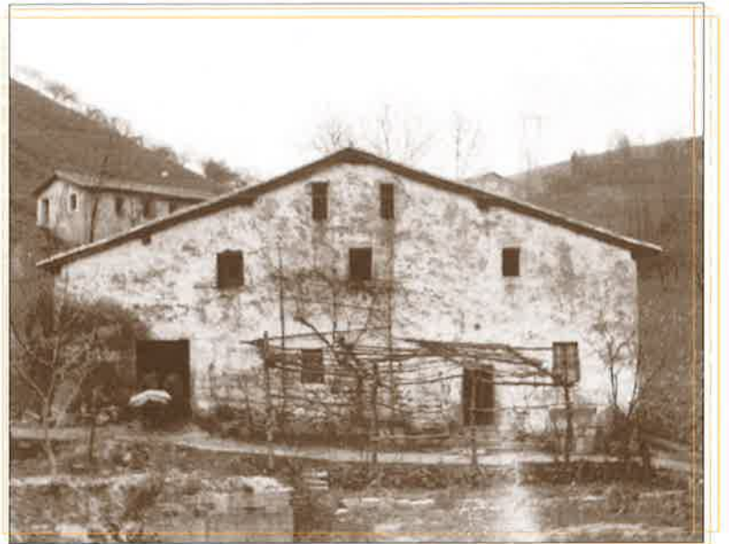
Amasako Pesus baserria, atzean Saletxea borda.

B aserriaz hitz egingo dugu Lumaneren 3. zenbakian. Bizitokia ez ezik, lantokia ere bazen baserria garai hartako baserriarentzat. Etxeko gela ezberdinen antolakuntzaren berri izango dugu, sukaldeak zuen funtzio garrantzitsutik abiatuta. Ukulua zen baserriaren beste gune nagusietako bat; aziendaren babestokia eta baserri-tarraren aterpeko lantokia. Babesean nahiz babesik gabe, lan egin behar izaten zuen baserriarrak. Baratzean edota inguruko ala urrutiagoko mendi-zelaietan. Barazkiak edo lurra lantzen. Batzuetan atxurra edo beste lanabesen baten laguntzaz, etxekoen edo auzokoen artean egin ohi zituzten lanak. Bestetan, animalia ondoan hartuta. Ganadua zaintzea ere baserriarraren eguneroko lana izaten zen. Garai hartan, ez zen oporrik izaten. Zein lan egiten zituzten orduko Amasako eta Villabonako baserriarrek? Zein lanabesen laguntzaz? Zer nolako emaitzak jasotzen zituzten? Hori guztiaren eta gehiagoren berri jakin-go dugu otsailaren lehen asteburuko aldizkarian. Ordura arte, segi ondo!