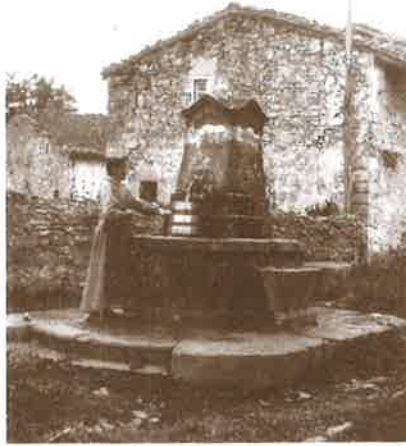
Plazako iturri ezaguna. Atzean Seroetxe eta Amallo baserriak.

Amasako plazako iturria ez da beti bertan izan. Mende luzetan, Amasak ez zuen iturriarik. Iturburuak bai, bi zeuden. Bata, Etxezarreta baserriaren gainean, 350 metroko altueran, Anaerreak zuen izena. Bestea, Uxa Mendi baserriaren gainean. Herritarrak bi txokoetara joaten ziren ur bila, gertuen egokitzen zitzaizenera. Marmitak eskuan, etxerako ur bila astoaren gainean joaten ziren asko. Ganaduarekin ere bai beste asko. 1830 urte inguruan, hainbat amasar Argentina-ra abiatu zen lan bila. Haietako batzuk, urre itxuran ekarri zuten dirua, amasarrei iturri bat oparitzeko asmoz. Ordaindu zuten zenbateko zehatza ezagutzen ez bada ere, jakina da urre ontzatan ordaindu zutela. Uxa Mendi gaineko Urgoxo eta Eskumarraketa, bi iturburuetatik, ura ekartzeko bileta, Amasako elizan egin zuten. Baserritarrek auzolanean zabaldu zuten zanga, ura-