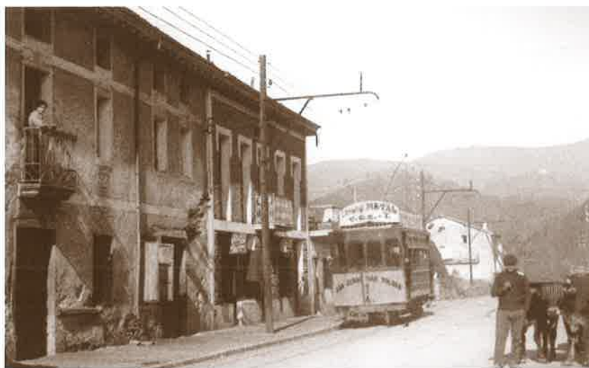
Tranbia, Izkina paretik igarotzen. Aurrean, barbetarren etxea eta Perratzailena. Bidean, baserritarra idiekina.