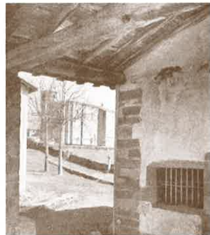
Santa Kruz ermitaren estalpetik, Tourseko San Martin elizaren ikuspegia.

xe ezagutu genituen, berdin-berdin. Gizonzkoen aldea batetik, eta emakumezkoena, bestetik". Amasako eliza eraikitzen, 298 urte igaro zituzten. Familia bereko lau belaunaldi ezberdinetako kideak izan ziren lanaren arduradun nagusiak. Hala ere, amasarrek auzo-lanean aritu ziren. Eliza altxatzeko harria, Loatzoko harrobitik ekarri zuten. Villabonan elizarik ez zen garaian, Amasara igotzen zen villabonatar asko mezetara, "Iruratik edo Andoaindik ere etortzen zen jendea Amasako meza entzuterara. Gu jaio aurretik gertatu zen hori; jaio ginezerako, Andoainen-eta bai baitzeuden elizak. Baina, hori esaten zen, kanpotik jende asko etortzen zela Amasako elizara. Gainera, elizkizun asko izaten zen Amasan. Esaterako, Aste Santuko elizkizun guztiak Amasan izaten ziren; parrokia Amasan zegoen, erretorea ere Amasan bizitzen zen".