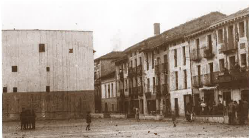
Berdura Plazatik abiatuta, Kale Nagusian ageri diren etxeak, hauxek; Aiestaran, Albaite, Periodista, Anttonenea, Larrañaga, Olaso, Exekiel eta Barrenetxe.

lako zetorkion. Txokolateaz gain, piperrezko erroskilak, erroskila gozoak nahiz kandelak ere egiten zituzten eta plaza inguruko etxean, konfiteria ere bazuten.