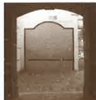
Frontoi motza, luzearen parean.