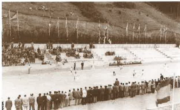
Historiako mundu mailako errebote partida bakarria, Amarako pilotalekuan.