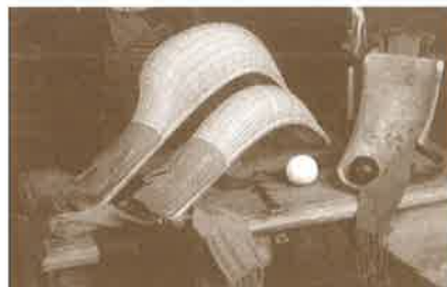
Zestoak eta pilotak, erreboteko tresnak.