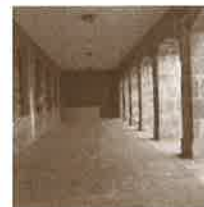
Frontoi luzea udaletxe arkupeetan.

raian, pilota eskola bazen baina, ez zegoen pilotalekurik herrian. Udaletxe azpiko arkupeetan frontoi luzea deitzen zioten gunea zegoen eta parean, motza. Hortxe jokatzeko ziren pilota partidak hasieran. Villabonako pilotariak tarte horietan jokatzera ohituta zeuden baina, kanpoko pilotariak etortzen zirenean, nahikoa lan