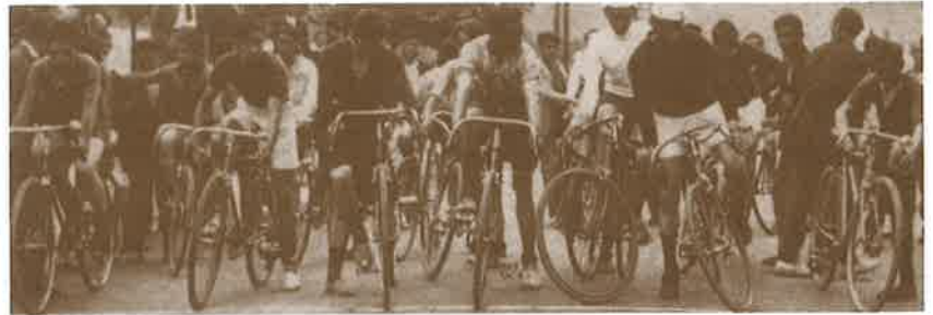
Txirrindulari gazteak, lasterketari ekin aurretik, Villabonako plazan.