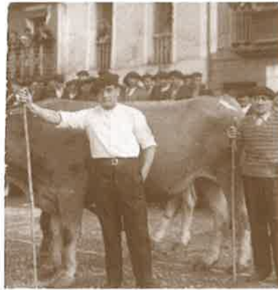
Idi-parea eta apustulariak, dema hasi aurretik, Villabonako plazan.