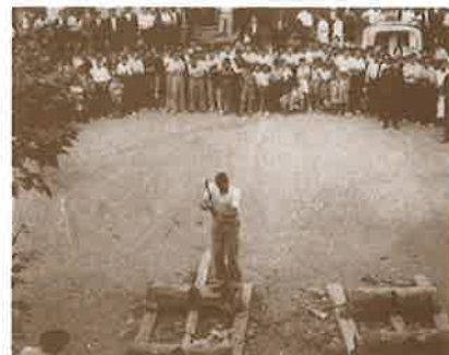
1935eko Santio jaietako aizkora-apustua. Aizkolari bakarra lanean, begira, herritar multzoa.