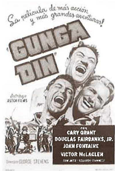
Gunga Din filmeko kartela.