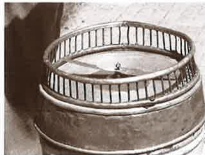
Barkilleroek antzeko erruleta erabiltzen zuten zozketa egiteko