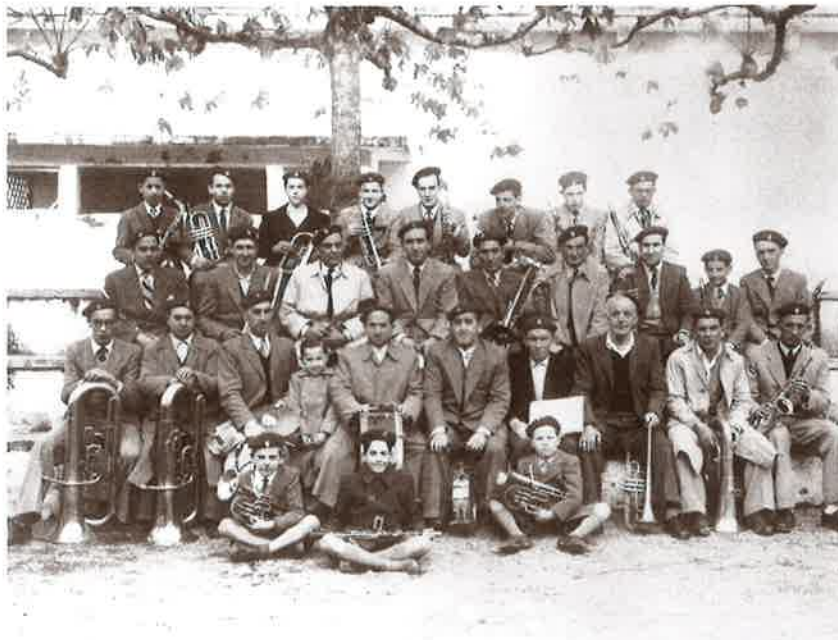
Herriko musika bandako kideak 1954 urtean.

Igandeaz gain, elizak jarritako jai egunak gaur baino ugariagoak ziren orduan. Hizlariek jai egun haiek lanegun bihurtzea pena dela uste dute. "Lehen, beste santu egun batzuen artean, San Juan eguna jai izaten zen leku guztietan". Gainerakoan, lantokiek jai egun bat zuten, "fabrika edo langintza bakoitzaren santua egokitzen zenean, hain zuzen". Batzuek bazkariarekin ospatzen zuten, besteek hamaiketakoarekin..., mokadurik gabe ere izaten zen ospakizunik kasuren batean.