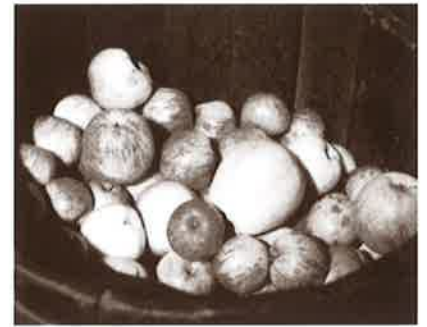
Sagar helduberrien uzta goxoa.

Ardoa egun berezi-berezietako bazkarietan soilik edaten zuten. "Ardoa gutxitan aterako zen mahaira, ondo gordeta izaten zen". Gainerakoan, pitarra gehienetan, "lehen sagarrarekin egindako sagardoari deitzen zitzaion pitarra. Aurreneko sagardoari. Hari ur dezente botatzen zitzaion. Gero, barrika hasi eta sagardo ona izaten zen hasieran, baina, barrika jaisten ari zen heinean, gazi-itu egiten zen sagardo. Ura botatzen zitzaion gozatzeko. Huraxe zen pitarra".