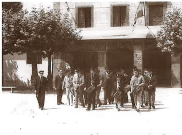
Santio jaietan txistulariak Villabonako kaleak zeharkatzen.

"Tabernak eta elkarteak ere baziren. Guzti-guztiak ez ginen hain goiz erretiratuko baina, goizean jaiki..., bai azkar!"