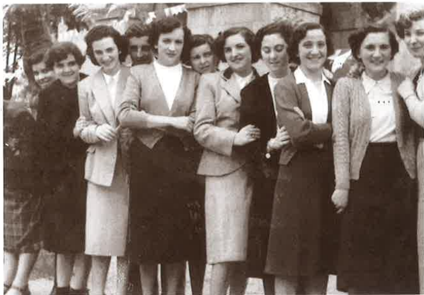
Villabonako neska gazteak eliz-barrutiaren irekieran, 1952 urtean.