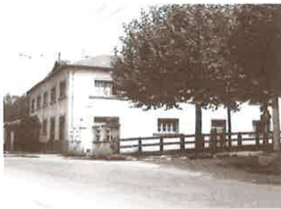
Garai bateko Gurea zinema, egungo leku berean.