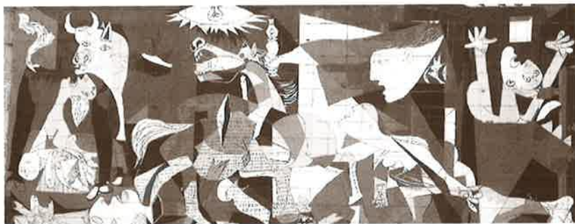
Gernikako bonbardaketan bizia galdu zuten euskaldunen omenez Picassok marraztutako lan ezaguna.

ez zen hala gertatu. Beraz, Oriotik Mundakara egin genuen ihes. Zortzi edo bederatzir urte izango nituen nik. Mundakan txoriekin afizio handia zuen lagun bat egin nuen. Niri ere asko gustatzen zitzaizkidan eta birigarro kabi bila joan ginen 1937ko apirilaren 26 hartan. Gernika aldeko mendietara abiatu ginen eta han genbiltzala, abioiak sentitu genituen. Pum eta pum hotsak entzun zitezkeen nonahi. Gure abioiak ez zirela eta Gernika bonbardatzen ari zirela konturatu ginen. Zulo batean gordeta egon ginen tarte luzean. Etxera itzuli ginenean, amak ez al dakizu zer gertatu den? , esaten zidan builaka. Nik baietz, zulo batean ezkatututa egon ginela. Hurrengo egunean Mundakako elizako plazan gudariekin bazkaldu nuela gogoratzen dut. Andoaindar bat baino gehiago zebilen han, tartean gure anaia. Menuaz ere ondo gogoratzen naiz: Anchoas a la papilló ”.