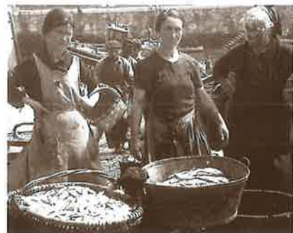
Irudiko arrain-saltzaileen pare ibiltzen ziren Amasan eta Villabonan.