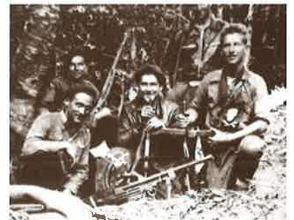
Makiak borrokarako prest.

bait. Baina herrian ez ziren sumatzen”. Makien artean espainiarrak ziren nagusi, “euskaldunak ere izango ziren tartean baina Espainiatik etorritako mutilak zi- ren gehienak. Guk ez genituen ezagu- tzen. Ez dakigu zein ibiliko zen tartean”. Irun aldean makien mugimendua handia izan zela aipatu dute, “muga inguruan ibili ziren batez ere. Han izan zen mug- imendu nagusia. Armatuta ibiltzen zi- ren”.