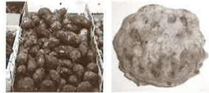
Boniatoa eta taloea sabela betetzeko jakirik zabalduenak.

Artoarekin eginda, beste opil moduko bat ere jaten zuten, "arto-irinarekin masa egin eta taloak baino xerra potoloagoak ere egiten ziren. Artoa deitzen zitzaion. Aza hostoan bildu eta sutan egiten ziren", gogoratu dute hizlariak.