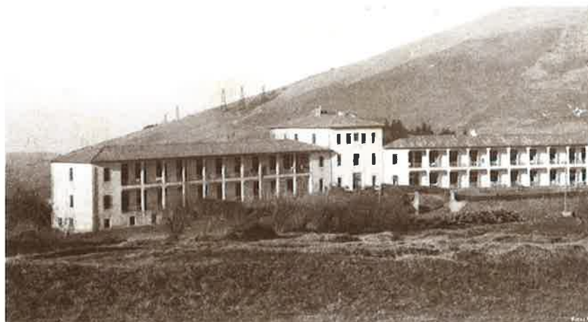
Andezarrateko erietxea bota aurretik ateratako irudia.