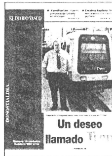
Portada de la revista 'Bertan'.

El turno de guardia le corresponde atenderlo durante la jornada de hoy, miércoles, a la farmacia Gorospe, que se encuentra ubicada en la calle Rikardo Arregi, número 12, y cuyo número de teléfono es el 943-592415.