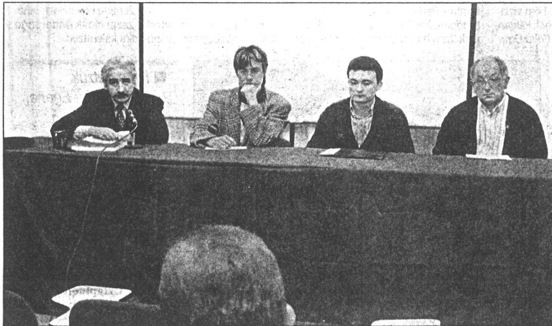
La sala de cultura Urigain será el lugar de presentación de la revista.

En defensa de Euskalerría Irratia La Asociación Cultural Manuel