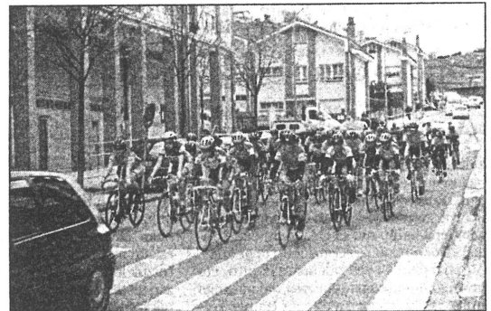
Las ciclistas agrupadas en pelotón.

Por último, la prueba élite de 63 kilómetros con la subida final a Xoxoka fue ganada por Eneritz Iturriagaetxeberria del Cielos, con un tiempo de 1 hora 51 minutos y 25 segundos y aventajó en 2 minutos y 53 segundos a Berta